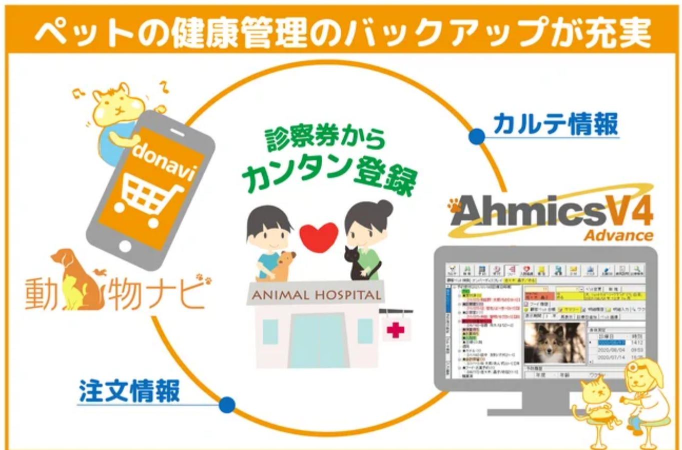
動物ナビ×Ahmics連携イメージ

「AhmicsV4 Advance」との連携にて、診察券から「動物ナビ」への簡単登録や「動物ナビ」での購入商品をカルテ上で閲覧することが可能に。